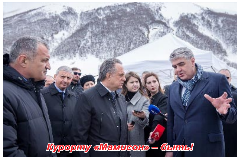
Курорту «Мамисон» – быть!

– В сфере финансовой деятельности налоговые и неналоговые доходы планируются в сумме 427,877 тыс. руб., что на 11,3% больше, чем в 2020 году. В системе образования планируется: ремонт спортзала в СОШ селения Црау, а также открытие центров образования гуманитарного и цифрового профилей «Точки роста» в 9 общеобразовательных организациях района. В аграрно-промышленном комплексе продолжится реализация программ по развитию АПК, практика поддержки семейных форм хозяйствования, комплексного развития сельских территорий. Планируется также провести инвентаризацию земельных участков и объектов недвижимого