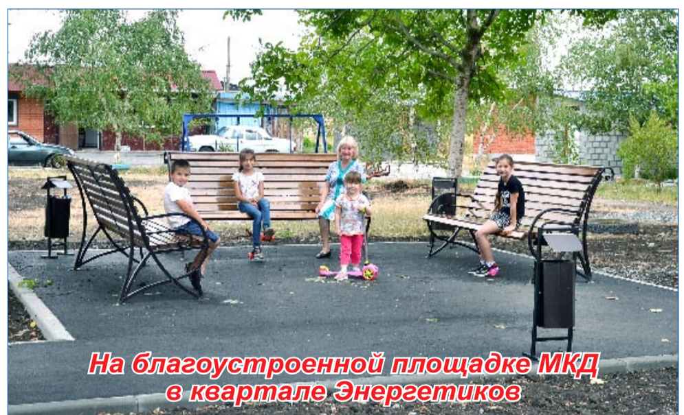
На благоустроенной площадке МКД в квартале Энергетиков