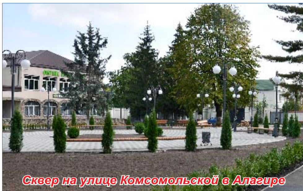
Сквер на улице Комсомольской в Алагире

Вопросы задавала Римма ДОЕВА.